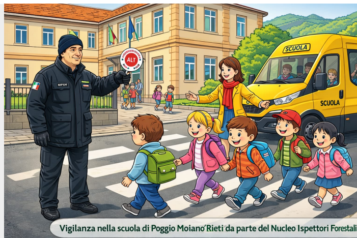
Vigilanza nella scuola di Poggio Moiano Rieti da parte del Nucleo Ispettori Forestali.

Publicato il Gennaio 14, 2026 di Redazione